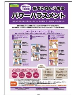
12 パワハラ対策 気づかないうちに 行われてしまうパワハラの解説