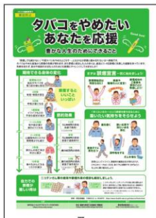
14 禁煙支援 禁煙したい人の モチベーションアップと アドバイス