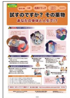
10 違法薬物の 注意喚起 違法薬物について これだけは知っておこう!