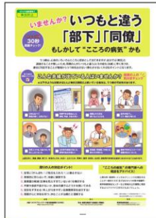
6 ストレス対策② (周囲チェック編) 周りの人の気づきチェックと 対応ポイントを解説