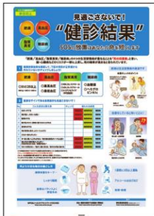
9 健診結果の活用 健診結果をもとに チェック項目や 毎日の過ごし方を解説