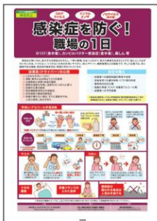
13 感染症対策 運輸事業者に特化!! 職場における 感染症対策を解説