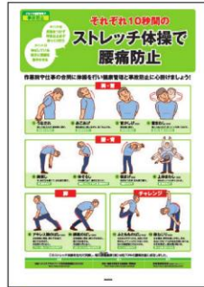
3 腰痛対策 手軽にできる ストレッチ体操を解説