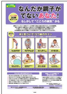
5 ストレス対策① (自己チェック編) 自分で行ううつ病の 前兆チェックと対処法を解説