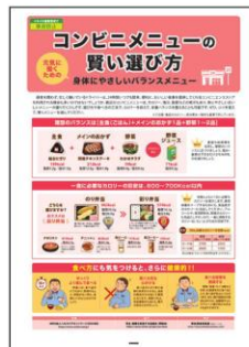
15 コンビニメニューの 選び方 組み合わせのポイントと 適切なカロリー