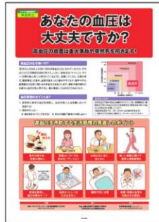
7 高血圧対策 生活習慣の見直し ポイントを解説