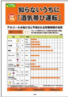
1 残酒対策 酒類と量で アルコール代謝を解説