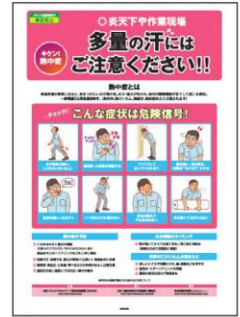
4 熱中症対策 症状と予防法、 水分補給、対処法を解説