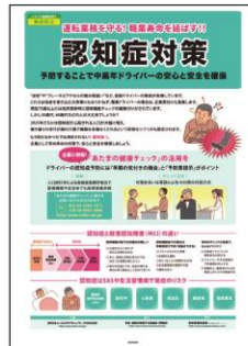
11 認知症対策 予防の解説と 「あたまた健康チェック」の 活用を案内