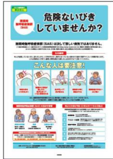
2 睡眠時無呼吸症候群 (SAS) 対策 SASの症状と影響・ 予防策を解説